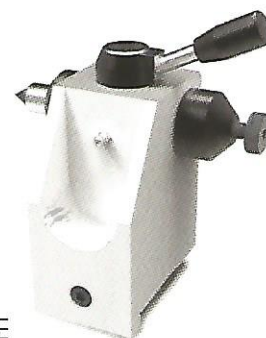
CONTRE-POUPÉE actionnée manuellement